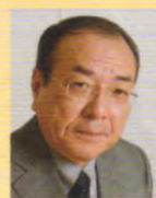
吉村 泰典 (内閣府官房参与 慶應義塾大学名誉教授)