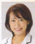
森 まさこ (参議院議員 前少子化担当大臣)